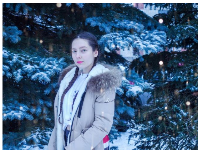
«А я мороза не боюсь»