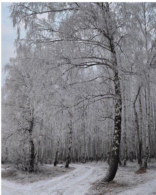
«Зимняя сказка»