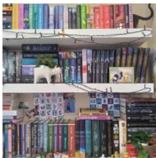
Мои книжные полки