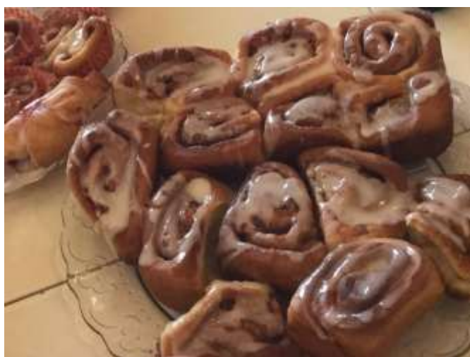
Наши булочки с корицей