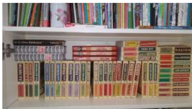
Мои книжные полки

Нередко для подростков рекомендуют детские или сложные для понимания произведения. Но человек сам должен выбрать жанр, который ему будет по душе. Нужно познакомиться с разными жанрами и авторами, чтобы найти понравившиеся. Также очень важный совет – не бояться закрыть книгу, если она вам не понравилась. Это помогает читать только реально хорошие произведения.